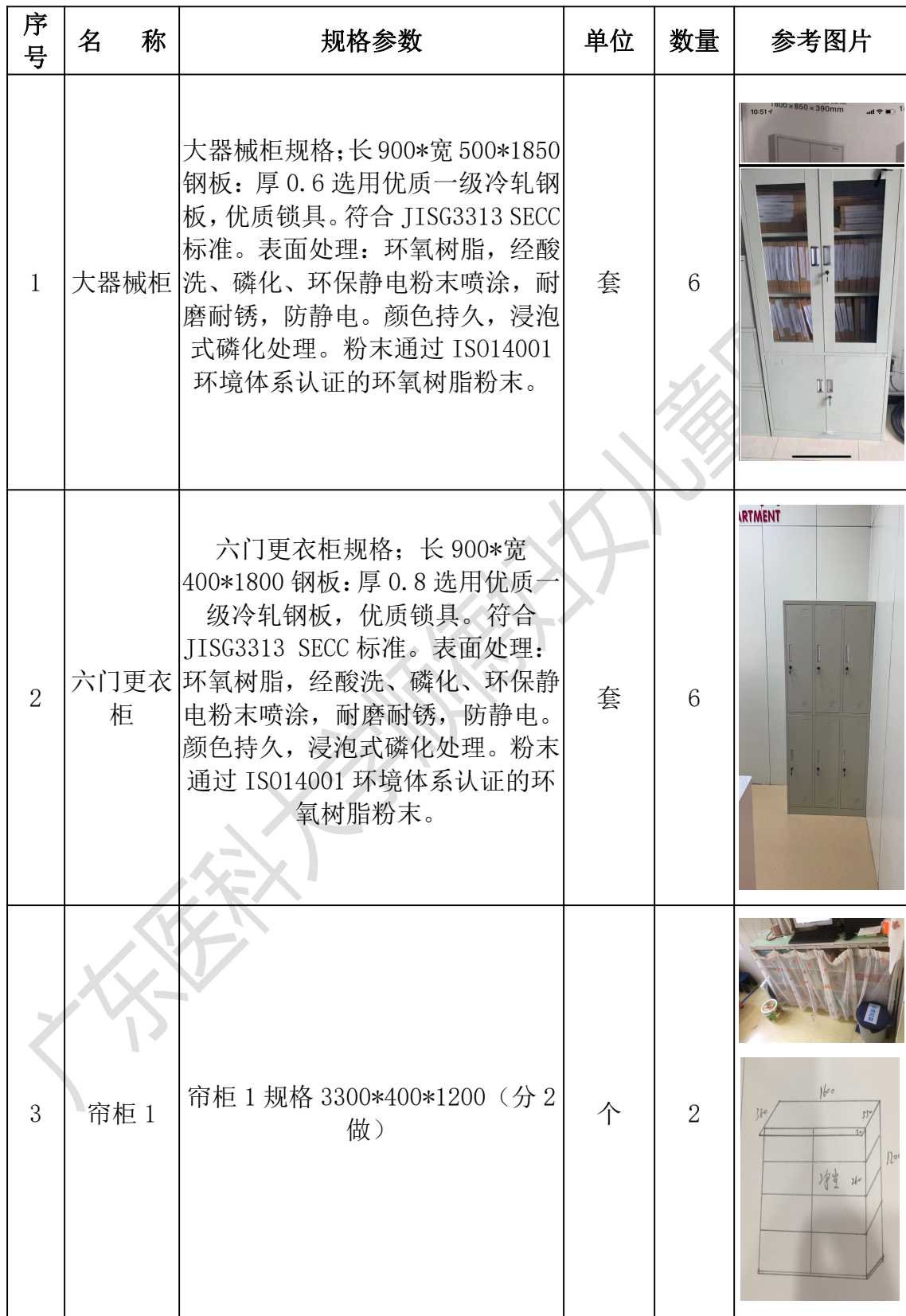
广东医科大学顺德妇女儿童医院 12 号楼家具采购项目需求表